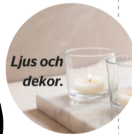
Ljus och dekor.

Personer med enskilda firmor har råkat illa ut under pandemin då de, till skillnad från större företag, stått utan krisstöd.